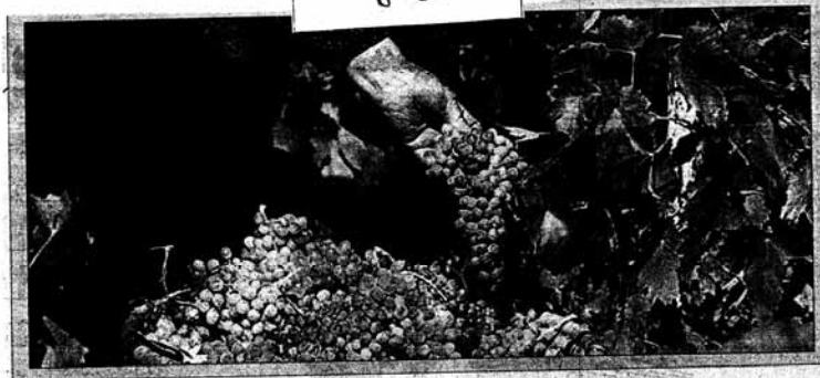
جشنواره ملی انگور در تاکستان استان قزوین برگزار شد و زنان که در برداشت این محصول نقش مهمی دارند، در جشنواره هم حضور چشمگیر داشتند.