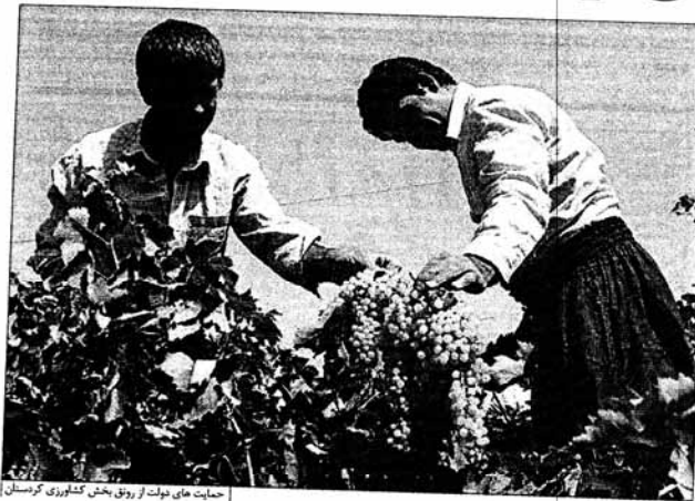
حمایت های دولت از رونق بخش کشاورزی کردستان

ایجاد صنایع فرآوری محصول انگور جهت تولید کشمش، آمیوه و سایر فرآورده‌های آن می‌تواند به ایجاد اشتغال پایدار، رونق اقتصادی منطقه و افزایش درآمد باغداران و در نهایت ایجاد انگیزه در میان آنها کمک کند. فرآخوان جذب سرمایه‌گذار در این بخش و حمایت‌های مادی و معنوی طریق اعطای تسهیلات بانکی با سو پانین و بازپرداخت دراز مدت می‌تواند در جذب سرمایه‌گذار در این بخش مؤثر باشد.