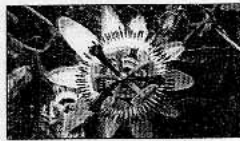
ترویج کشت این گیاهان بیشتر توجه شود.

سیار در ادامه افزود: در استان قم بیش از ۲ هزار و ۵۰۰ هکتار از زمین‌های کشاورزی به کشت سبزیجات اختصاص یافته که بخش عمده‌ای از آنها جنبه دارویی دارند.